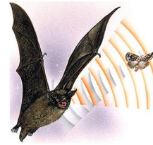
Document 1: Chauve-souris utilisant l'écholocalisation pour détecter un papillon

L'écholocalisation, consiste à envoyer des sons et à écouter leur écho pour localiser, et dans une moindre mesure identifier, les éléments d'un environnement. Elle est utilisée par certains animaux, notamment des chauves-souris et des cétacés, et artificiellement avec le sonar. Certains papillons de nuit, notamment les Arctiinae, ont acquis des organes tympaniques qui détectent les ultrasons des chauves-souris insectivores. Pour fuir leur prédateur, ils peuvent émettre eux-mêmes des ultrasons pour brouiller le radar des chauves-souris, comme le font certains criquets et coléoptères, ou émettre des clics ultrasoniques d'avertissement pour leur congénères.